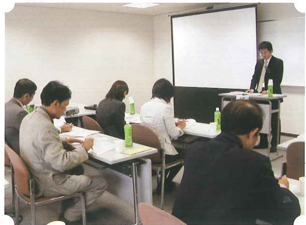
新任経営特別相談員の養成講習

今年度も、新たに6名の方に委嘱されることとなり、昨年養成講習会を受講され、4月1日付けで岐阜県知事から委嘱状が交付されました。今後の皆様のご活躍を期待します。