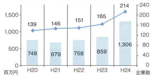
上位の5業種(細分類)