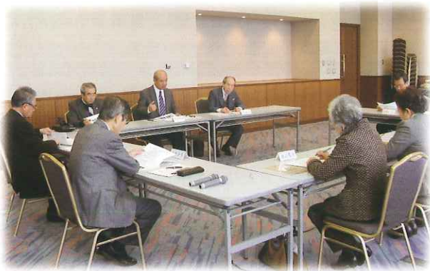
各委員による協議会での討議

また、近年問題となっている買い物弱者の視点から、大企業と地域の生衛業との連携や、すみ分けを視野に入れた方法も有効では、との提案もされました。