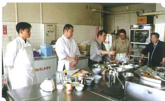
薬膳料理の実践開発