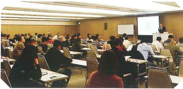
24年度クリーニング師研修(岐阜会場)

クリーニング師及びクリーニング業に従事する方は、「クリーニング業法」で、クリーニング師研修や従事者講習を3年に1度受講することが義務付けられています。最近のファッション化による繊維製品の素材の多様化、溶剤等による環境問題、消費者からのクレームの増加など、今日のクリーニング業界では様々な問題に直面しています。その業務に携わる方々がこれらの諸問題に適切に対応できるよう、この研修や講習を実施するものです。