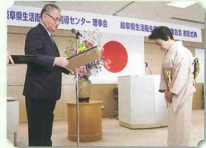
瀧会長より感謝状贈呈